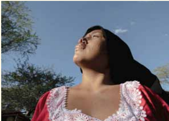
Aus der Ausstellung „Klimagerecht leben“

Hinzu kommt, dass vor allem wohlhabende Menschen und Länder über Mittel verfügen, sich gegen die Folgen der Klimakrise zu schützen und materielle Schäden zu reparieren.