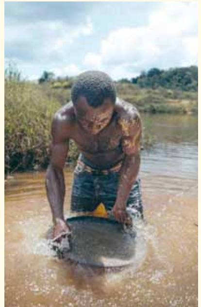
Aus der Ausstellung „Klimagerecht leben“