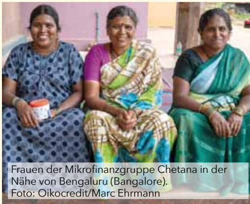
Frauen der Mikrofinanzgruppe Chetana in der Nähe von Bengaluru (Bangalore).

Zu diesem Vortrag mit Diskussion lädt der Fairtrade Kreis Nordfriesland mit den Fairtrade Towns Husum und Niebüll.