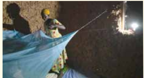
Aus der Ausstellung Klimagerecht leben, Foto: Sandra Weller

Mehr als 20 Fotografinnen und Fotografen aus aller Welt machen in ihren Fotoreportagen deutlich, wie sehr der Klimawandel die Welt verändert und was in aller Welt unternommen wird, um die Klimakrise aufzuhalten.